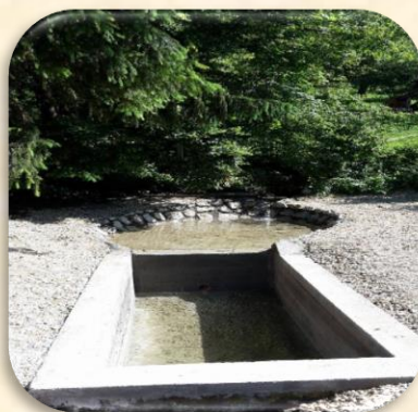
Izvor pitke vode Žlib, Kraj Donji