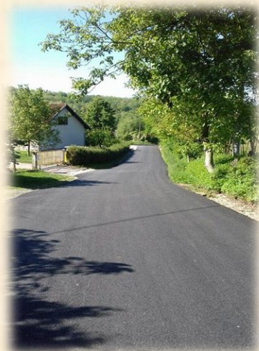
Asfaltiranje Brdovečke ulice