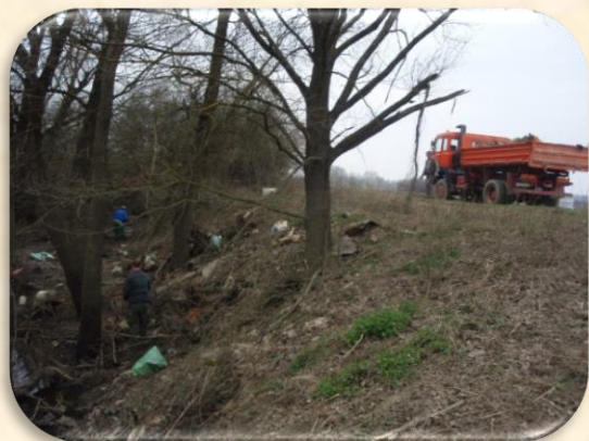
Lovačko društvo Vidra, Lovna grupa Marija Gorica - akcija čišćenja Sutlišća