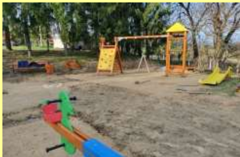
Dječje igralište u Žlepcu