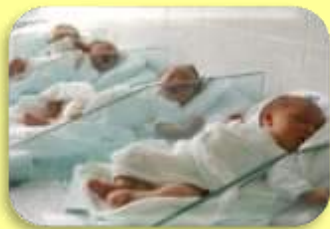
Pomoć za novorođenče 2.000,00 kn